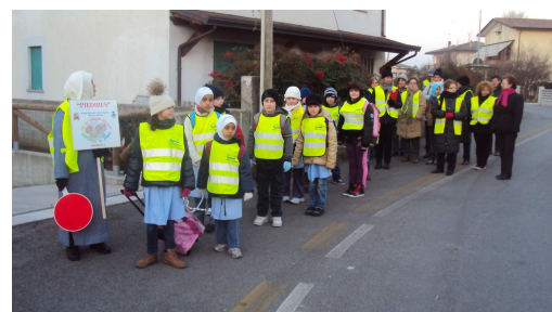
I Piedibussini di Mareno di Piave

Inoltre, il nostro Piedistaff sta lavorando su altri Comuni: Farra di Soligo, Vittorio Veneto, Orsago e Cordignano sono i prossimi obiettivi!